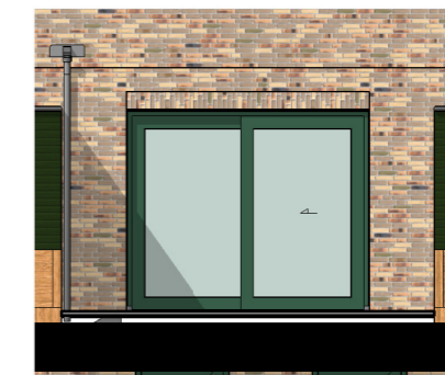
Achtergevel Schuifpui schaal 1:100